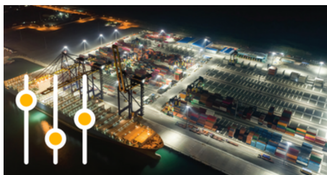
Contrôle d'éclairage sans fil