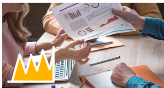
Collecte et analyse de données